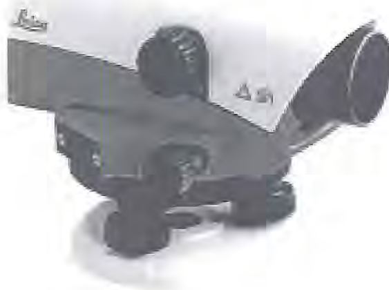
Общий вид нивелиров с компенсатором NA 720, NA 724, NA 728, NA 730

Пломбирование крепёжных винтов корпуса нивелиров с компенсатором NA 720, NA 724, NA 728, NA 730 не производится; ограничение доступа к узлам обеспечено конструкцией крепёжных винтов, которые могут быть сняты только при наличии специальных ключей.