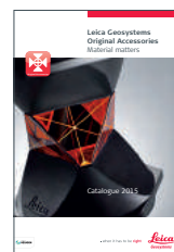
Оригинальные аксессуары Leica Geosystems