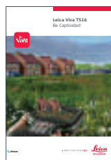
Leica Viva TS16

Иллюстрации, описания и технические характеристики могут быть изменены в одностороннем порядке. Все права защищены. Правообладатель Leica Geosystems AG, Хербрюгг, Швейцария, 2015. 841871en – 10.15 – INT