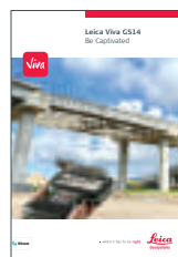
Leica Viva GS14