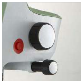
ВЫСОКАЯ ПРОИЗВОДИТЕЛЬНОСТЬ БЛАГОДАРА АВТОФОКУСИРОВКЕ