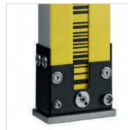
ИСПОЛЬЗОВАНИЕ КODOVЫХ ИНВАРНЫХ РЕЕК