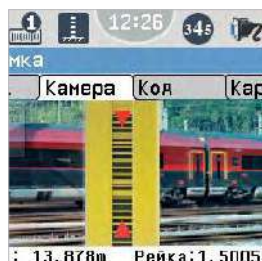
НАВЕДЕНИЕ С ПОМОЩЬЮ ЦИФРОВОЙ КАМЕРЫ