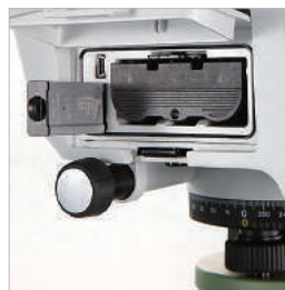
УДОБНЫЙ ОБМЕН ДАННЫМИ