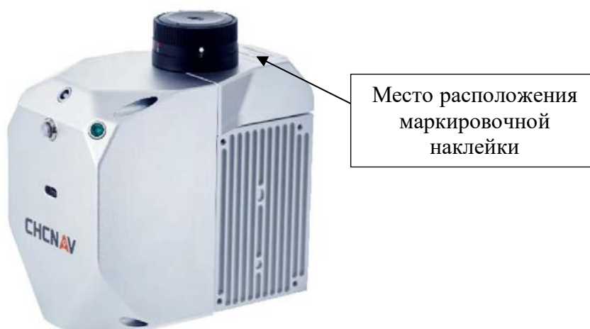
Рисунок 1 – Общий вид сканеров лазерных аэросъёмочных AlphaAir 450