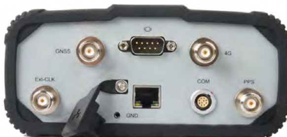
Рисунок 3 – Общий вид аппаратуры P5U со стороны задней панели