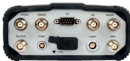
Рисунок 2 - Общий вид аппаратуры PrinCe P5E со стороны задней панели