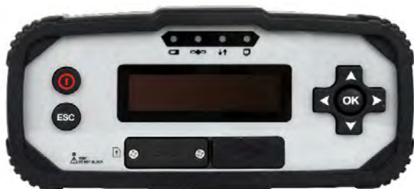
Рисунок 1 - Общий вид аппаратуры со стороны лицевой панели