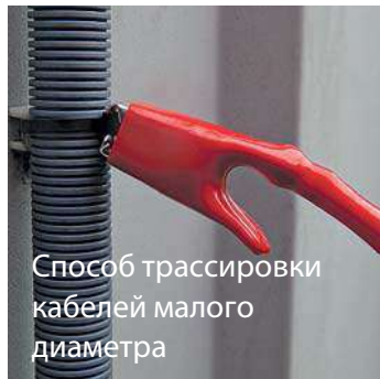
Способ трассировки кабелей малого диаметра