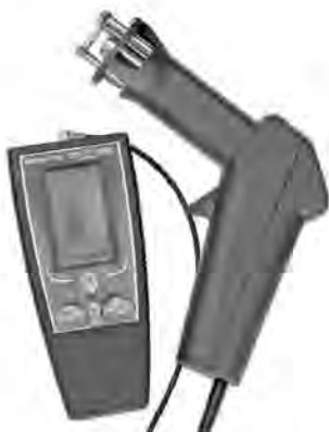
Рис. 3.1. Общий вид прибора.