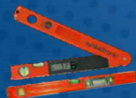
лазерные и измерительные инструменты