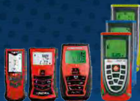
лазерные дальномеры CONDROL X2, Metro CONDROL (60, 100) Disto D2, D3, A5, A6, A8