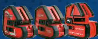
мультипризменные лазерные нивелиры XLiner Duo, XLiner Combo, XLiner Pento CONDROL