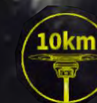
До 10 км по радио