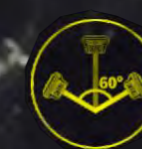
Компенсация наклона до 60°