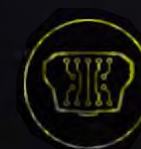
Встроенная УКВ антенна