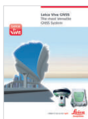
Leica Viva GNSS Брошюра