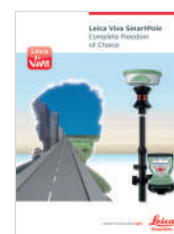
Leica Viva SmartPole Брошюра