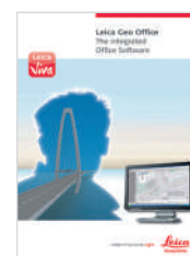
Leica Viva LGO Брошюра