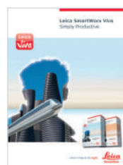
Leica SmartWorx Viva Брошюра