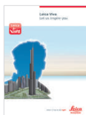
Leica Viva Обзор

Иллюстрации, описания и технические данные не приложены. Все права защищены. Отпечатано в Швейцарии - Leica Geosystems AG, Хеебрюгг, Швейцария 2013.