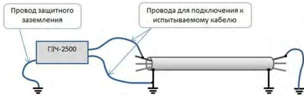
Рисунок 5. Трассировка и выбор кабеля из пучка.