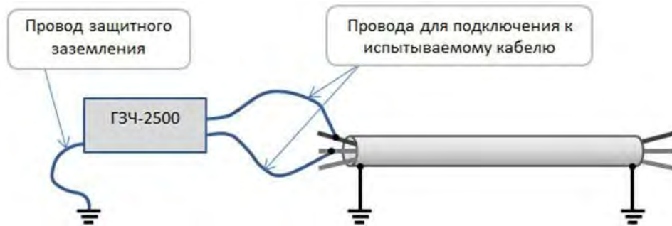
Рисунок 6. Поиск мест замыкания жил.

9.2 Обязательно заземлять второй конец кабеля при использовании режима повышенного напряжения!