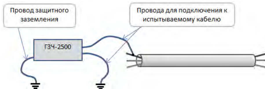
Рисунок 4. Трассировка и поиск дефектов кабеля.