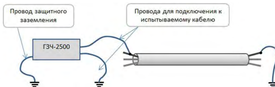
Рисунок 3. Трассировка кабеля.

9.1 Определение трассы подземного кабеля или трубопровода при непосредственном подключении к коммуникации можно проводить несколькими способами: